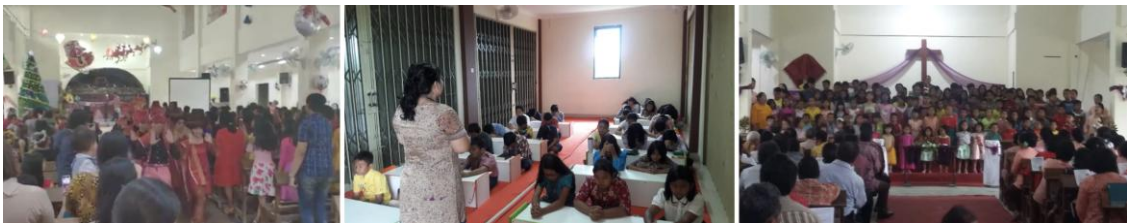
Gambar 1. Dokumentasi Kegiatan GBKP Runggun Tangerang

Idealnya, lingkungan bangunan ibadah yang mewakili komunitas etnis tertentu seharusnya memuat elemen visual yang mencerminkan identitas budaya jemaatnya secara jelas, baik melalui bentuk, ornamen, maupun sistem penandaan kawasan [7], [8]. Identitas visual semacam ini berfungsi memperkuat rasa memiliki, meningkatkan keterbacaan ruang, serta menegaskan keberadaan institusi dalam konteks permukiman. Namun, kondisi nyata di GBKP Runggun Tangerang menunjukkan adanya ketidaksesuaian antara kebutuhan tersebut dan situasi eksisting. Gapura yang menjadi elemen pertama yang dilihat pengunjung belum menampilkan ciri visual Batak Karo sehingga tidak mampu merepresentasikan identitas komunitas secara memadai. Perbedaan antara kondisi ideal dan kondisi aktual inilah yang melatarbelakangi urgensi intervensi desain pada area pintu masuk gereja.