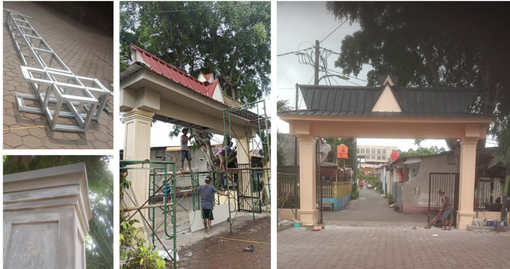
Gambar 7. Implementasi Konstruksi

Elemen fungsional lain yang diintegrasikan adalah sistem pencahayaan eksterior yang dipasang pada bagian kolom dan perimeter atap untuk meningkatkan visibilitas pada malam hari, sekaligus menciptakan orientasi visual yang lebih jelas bagi jemaat dan pengunjung. Pencahayaan ini tidak hanya berfungsi sebagai aspek keamanan, tetapi juga memperkuat kehadiran gapura sebagai titik masuk utama, terutama pada kegiatan gereja yang berlangsung pada malam atau menjelang dini hari. Sistem pencahayaan dirancang agar selaras dengan komposisi arsitektural tanpa mengganggu elemen budaya pada bagian atas gapura, sehingga nilai estetika tetap terjaga.