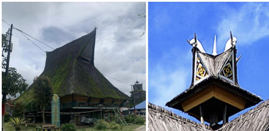
Gambar 4. Rumah Adat Karo Siwaluh Jabu

Bentuk atap dan proporsi bangunan tradisional Karo merupakan representasi fisik dari nilai-nilai kolektif dan filosofi komunal masyarakat. Atap tinggi dan runcing pada rumah adat Karo melambangkan penghormatan kepada roh leluhur serta hubungan spiritual antara manusia dan penciptanya [18] (Gambar 4). Selain itu, ornamen motif pada atap pada struktur kayu diinterpretasikan sebagai perlindungan simbolis bagi penghuni dan cerminan tatanan kosmos [18].