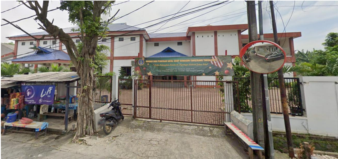
Gambar 2. Gapura Eksisting GBKP Runggun Tangerang

Gapura merupakan elemen arsitektur yang berperan sebagai pintu gerbang dengan fungsi simbolis, estetis, dan fungsional yang penting dalam berbagai kebudayaan. Selain menjadi titik masuk yang menarik secara visual, gapura sering merepresentasikan identitas budaya, sejarah, dan nilai-nilai lokal suatu wilayah. Kehadirannya dapat menjadi penanda karakter khas lingkungan sekaligus sarana penguat kesadaran masyarakat terhadap warisan budayanya [9], [10], [11], [12].