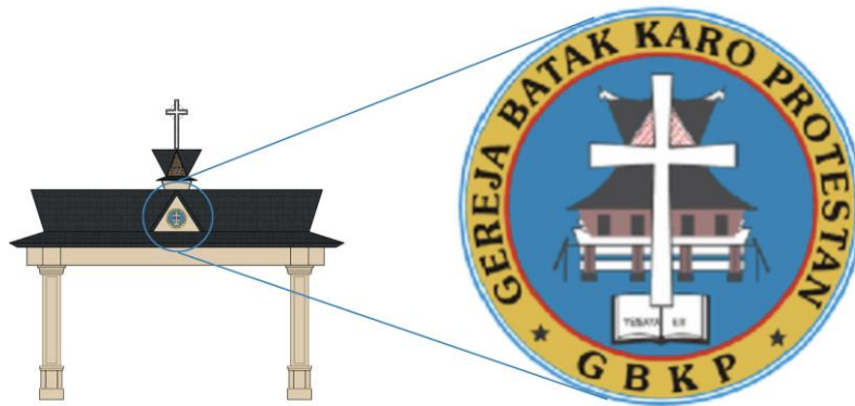
Gambar 3. Logo Gereja Batak Karo Protestan