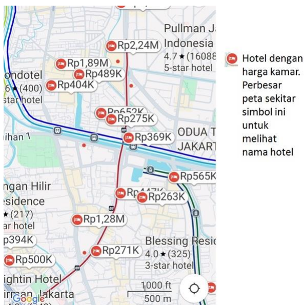
Gambar 2. Peta kawasan Dukuh Atas dengan tampilan fungsi hotel

Kedua, sesuaikan dengan skala garis menjadi satu garis sama dengan 1000 feet atau 500 meter (Gambar 1). Dalam posisi tersebut lakukan search untuk suatu penggunaan lahan tertentu, misalnya “hotel” (Gambar 2). Pada peta akan muncul semua hotel yang ada dalam lingkup peta tersebut. Catat semua nama hotel yang ada dalam peta tersebut.