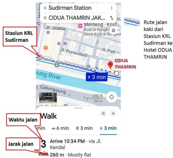
Gambar 3. Contoh peta kawasan Dukuh Atas dengan rute, waktu, dan panjang jalan kaki dari Hotel Odua Thamrin ke simpul transit KRL Sudirman

jarak jalan kakinya ke hotel tersebut. Pada peta akan muncul garis penghubung antara simpul transit dengan hotel tersebut. Klik icon pejalan kaki agar yang muncul adalah waktu dan jarak jalan kaki (Gambar 3).