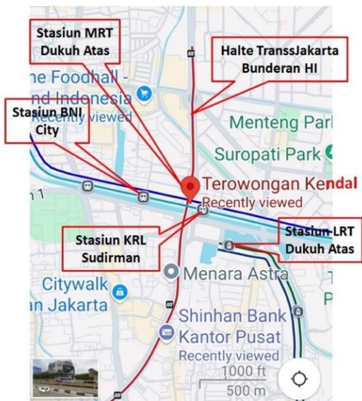
Gambar 1. Peta kawasan Dukuh Atas dengan lima simpul transit setelah skala peta disesuaikan sehingga satu garis sama dengan 1000 feet (500 meter).

transit tersebut. Titik ini kemudian menjadi acuan utama dalam mengukur jarak jalan dari berbagai fungsi guna lahan ke simpul transit hasil search tersebut.