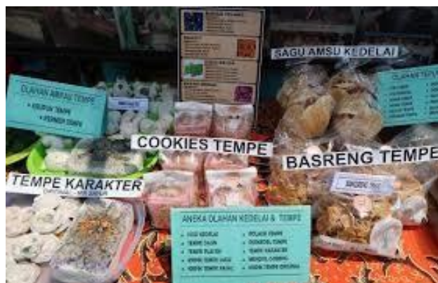
Gambar 5. Inovasi produk olahan tempe.

Partisipasi Fungsional yang diterapkan masyarakat Kampung Sanan mayoritas berupa pengembangan inovasi produk olahan maupun keterlibatan dalam acara tahunan yang dianggap menguntungkan. Awal dari bentuk partisipasi fungsional yang berlaku berupa adanya pembentukan Pokdarwis dengan visi misi untuk memajukan Kampung Sanan sebagai kampung wisata edukasi. Hanya beberapa masyarakat saja yang dapat tergabung menjadi pengurus Pokdarwis ini, keterlibatan masyarakat Kampung Sanan umumnya dilakukan dengan ikut menyaksikan berbagai program yang diusung oleh Pokdarwis Kampung Sanan. Partisipasi masyarakat dengan antusias cukup tinggi terdapat pada kegiatan pengembangan inovasi produk olahan tempe yang difasilitasi oleh Pokdarwis bekerja sama dengan beberapa stakeholder terkait (gambar 5). Kegiatan pengembangan produk olahan ini sudah diarahkan pada aspek keberlanjutan yang diantaranya terdiri atas pilot project penggunaan kotoran ternak sapi sebagai biogas, pelatihan pengolahan limbah kulit kedelai menjadi bibit nata de soya, hingga pengembangan produk olahan kuliner dari bahan baku limbah yang dapat dimanfaatkan kembali (gambar 6).