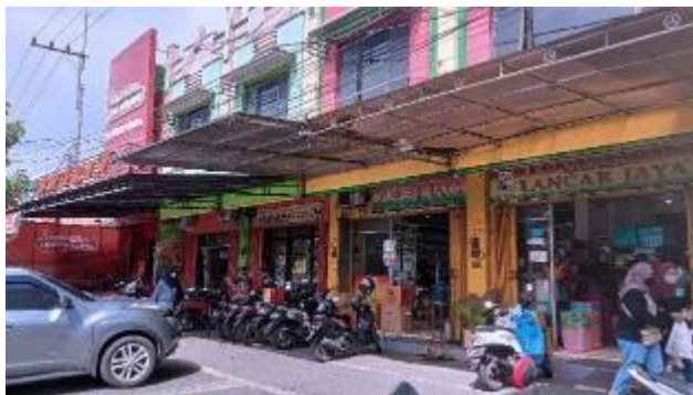
Gambar 4. Ruko-ruko penjual produk olahan tempe di area Kampung Sanan.

Struktur kepengurusan POKDARWIS Kampung Wisata Tempe Sanan dijelaskan pada gambar 3.