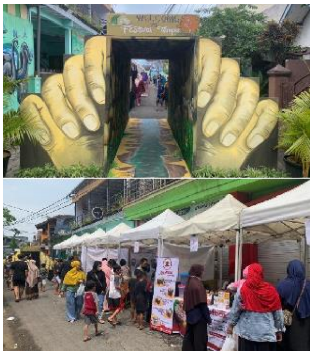
Gambar 7. Suasana Festival Kuliner Tempe.

Mayoritas kegiatan tersebut diikuti dengan baik oleh para pengusaha keripik tempe yang ikut berpartisipasi dan selanjutnya dikembangkan menjadi salah satu produk tambahan usahanya.