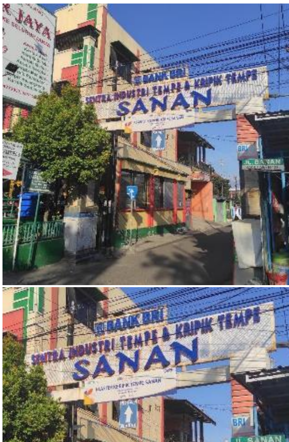
Gambar 2. Gapura Pintu Masuk Kampung Wisata Industri Keripik Tempe Sanan.

Kampung Wisata Industri Keripik Tempe Sanan Kampung Sanan Malang merupakan sebuah destinasi wisata edukasi dan kuliner yang terkenal sebagai pusat industri tempe dan keripik tempe terbesar di Indonesia. Kampung ini terletak di Kelurahan Purwantoro, Kecamatan Blimbing, Kota Malang dengan sentra industri pengusaha tempe yang tersebar di RW 14, 15 dan RW 16 (gambar 2). Ide pembuatan keripik tempe muncul sekitar tahun 1970-an dan diwariskan secara turun temurun [9][15]. Awalnya, pembuatan tempe dilakukan dengan alat-alat tradisional, namun sekarang telah beralih ke peralatan modern yang lebih efisien. Produk olahan tempe tersebut menjadi salah satu produk unggulan Kota Malang yang menjadi pilihan wisatawan untuk dijadikan oleh-oleh [9]. Dalam mengembangkan usahanya, pengusaha tempe di Sanan lambat laun mulai berinovasi menciptakan keripik tempe berbentuk bulat dan menambahkan beragam bumbu untuk memperkaya rasa, seperti rasa keju, balado, lada hitam dan sebagainya. Inovasi ini menjadikan Kampung Sanan sebagai pusat industri keripik tempe dan menarik banyak wisatawan yang datang untuk