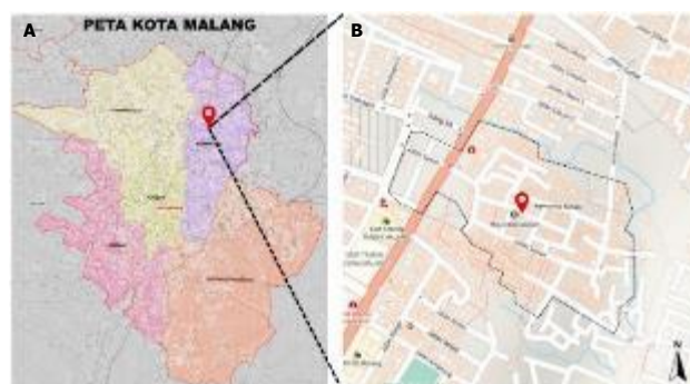
A. Peta Kecamatan Kota Malang. B. Peta Wilayah Kampung Sanan.

Penelitian ini merupakan penelitian kualitatif-deskriptif dengan pendekatan partisipatif melalui studi kasus. Penelitian dilakukan di Kampung Wisata Industri Keripik Tempe Sanan, Kecamatan Blimbing, Kota Malang (Gambar 1). Data didapatkan melalui wawancara bersama Ketua Kelompok Sadar Wisata (pokdarwis) sebagai keyperson yang terjun langsung dalam perancangan maupun pelaksanaan kegiatan di lapangan. Observasi langsung pada objek studi kasus dilakukan untuk mengamati dan melakukan dokumentasi terhadap kondisi fisik maupun non fisik lingkungan. Data pendukung didapatkan melalui berita online mengenai perkembangan pada objek studi kasus. Analisis data secara deskriptif didasari pada hasil wawancara maupun tinjauan studi literatur dari jurnal terkait mengenai desa wisata dan partisipasi sosial yang dilakukan untuk menjelaskan secara narasi tingkatan partisipasi masyarakat pada objek studi kasus beserta berbagai bentuk upaya inovasi yang dilakukan dalam rangka mencapai tujuan pariwisata berkelanjutan.