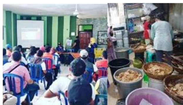
Gambar 6. Workshop pengembangan produk olahan tempe.