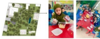
Gambar 10. Kegiatan bulanan yaitu cooking class

"Biasanya outbound dilakukan secara bersamaan sebulan sekali untuk PAUD dan SD, namun tetap tertib dan mengantri." (Narasumber 4)