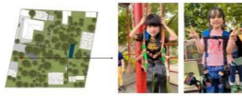
Gambar 9. Kegiatan bulanan yaitu outbound

Kegiatan bulanan adalah outbond berupa flying fox guna untuk melatih keberanian dan rasa percaya diri pada peserta didik.