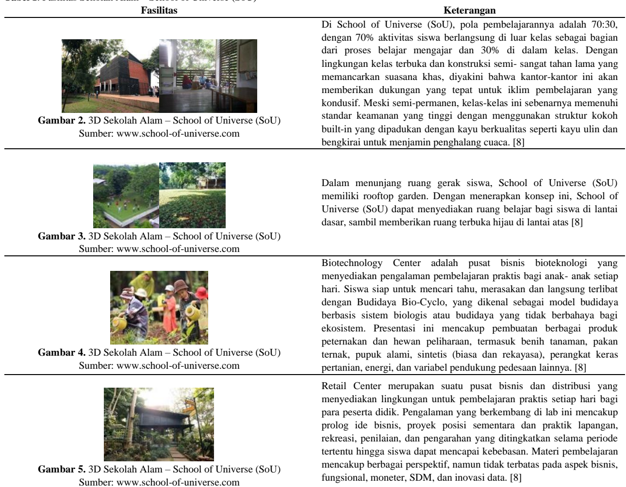
Tabel 1. Fasilitas Sekolah Alam – School of Universe (SoU)

Berikut pemaparan tentang beberapa fasilitas di Sekolah Alam – School of Universe (SoU) yang dapat dilihat pada Tabel 1.