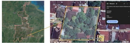
Gambar 6. Peta Kota Medan, Lokasi Sekolah Alam Semangat Bangsa

Penelitian ini dilakukan pada Senin, 24 September 2023 dan Senin, 23 Oktober 2023. Lokasi penelitian Sekolah Alam Semangat Bangsa ini terletak di Jl. Karya Jaya No. 75, Pangkalan Masyhur, Kec. Medan Johor, Kota Medan, Sumatera Utara 20147 (Gambar 6).