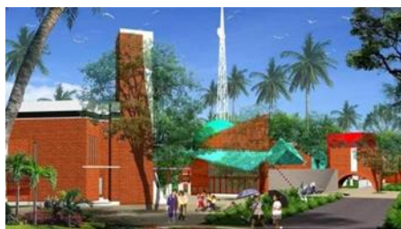
Gambar 1. 3D Sekolah Alam – School of Universe (SoU)

Desain dan arsitektur School of Universe (SoU) mencerminkan filosofi bahwa pendidikan yang baik harus mampu menumbuhkan hubungan yang harmonis antara manusia dan alam. Oleh karena itu, setiap elemen ruang dan material di sekolah ini dirancang untuk menciptakan pengalaman belajar yang tidak hanya memperkaya pengetahuan, tetapi juga mendekatkan siswa dengan alam sebagai bagian integral dari kehidupan mereka.