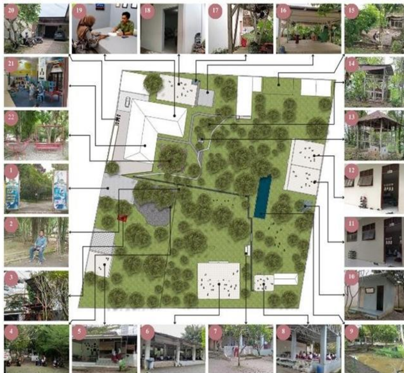
Gambar 13. Fasilitas Sekolah Alam Semangat Bangsa

Sekolah Alam Semangat Bangsa mempunyai fasilitas berupa ruang dalam maupun ruang luar yang dapat dilihat pada Gambar 13.