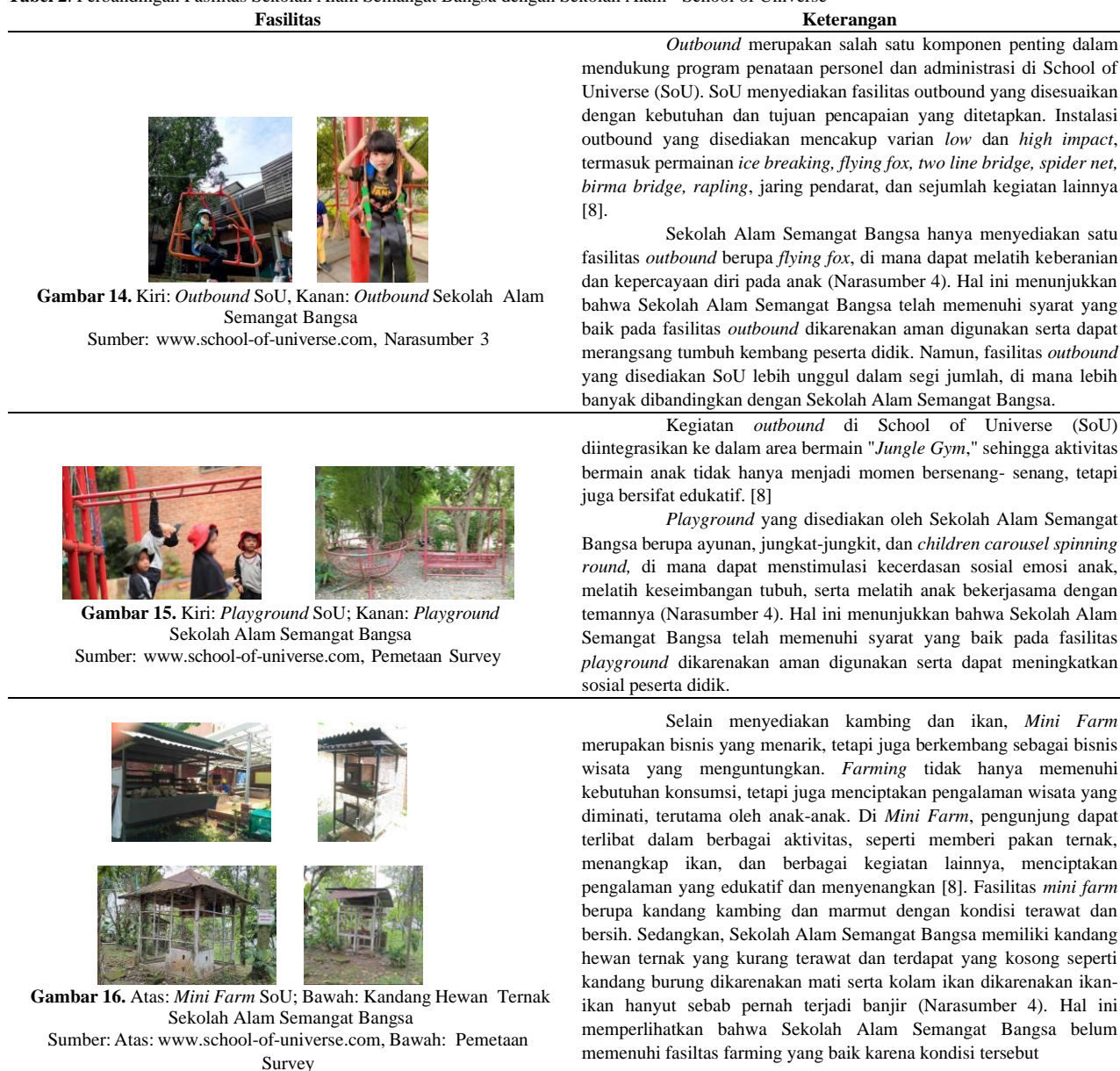
Tabel 2. Perbandingan Fasilitas Sekolah Alam Semangat Bangsa dengan Sekolah Alam - School of Universe

didik masih berusia 3-5 tahun agar peserta didik lebih aman dan masih dalam jangkauan guru. Berikut perbandingan beberapa fasilitas di Sekolah Alam Semangat Bangsa dengan Sekolah Alam – School of Universe yang dapat dilihat pada Tabel 3.