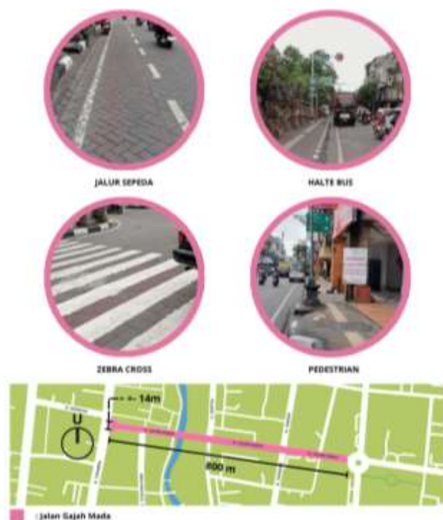
Gambar 4. Kondisi Ruang Jalan Terkait Lebar Jalan