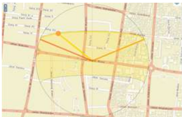
Gambar 5. Sun Path pada Jalan Gajah Mada Denpasar

Posisi bangunan di sepanjang Jalan Gajah Mada terletak di sisi utara dan selatan jalan, sehingga orientasi ini berpengaruh terhadap pencahayaan alami yang diterima oleh kawasan tersebut sepanjang hari. Dengan posisi yang sejajar dengan arah matahari terbit dan terbenam, keberadaan bangunan di kawasan ini tidak sepenuhnya mampu memberikan perlindungan dari paparan sinar matahari secara optimal. Melalui proyeksi matahari dari Sun Path pada gambar 5 pada pagi hari, sinar matahari langsung mengenai sisi timur bangunan, sementara pada sore hari, sisi barat bangunan yang lebih banyak terpapar. Hal ini menyebabkan beberapa area di jalan tetap terkena paparan sinar matahari dalam waktu yang cukup lama tanpa adanya bayangan yang cukup dari bangunan di sekitarnya.