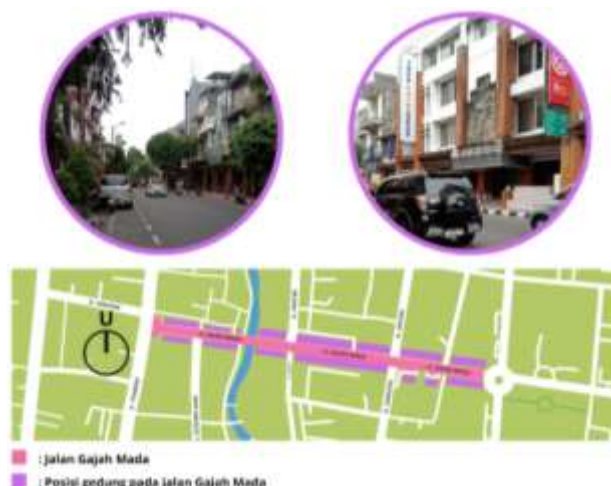
Gambar 3. Kondisi Ruang Jalan Terkait Ketinggian serta Posisi Bangunan

Kawasan Gajah Mada merupakan salah satu kawasan heritage yang memiliki nilai sejarah dan arsitektur yang khas. Bangunan-bangunan yang berada di sepanjang sisi kanan dan kiri jalan di kawasan ini menampilkan gaya arsitektur klasik yang unik, dimana bangunan yang terdapat pada kawasan Gajah Mada merupakan perpaduan antara ciri khas bangunan Cina, Bali, dan juga Belanda. Dominasi masyarakat yang tinggal di daerah tersebut merupakan pedagang sehingga bangunan lebih condong ke arah bangunan ruko (rumah toko), yang digunakan sebagai tempat tinggal dan juga berdagang [9]. Selain itu, karakteristik masyarakat yang tinggal di kawasan ini juga turut memengaruhi bentuk dan fungsi bangunan. Sebagian besar penduduknya adalah pedagang, sehingga bangunan yang ada cenderung berbentuk ruko (rumah toko). Ruko-ruko ini tidak hanya difungsikan sebagai tempat tinggal, tetapi juga sebagai tempat berdagang. Dari segi ketinggian bangunan, ruko-ruko di kawasan Gajah Mada umumnya memiliki struktur yang relatif tinggi, dengan ketinggian sekitar 2 hingga 3 lantai. Hal ini disesuaikan dengan kebutuhan ruang untuk aktivitas perdagangan serta tempat tinggal bagi para pemiliknya. Posisi bangunan di kawasan ini juga memiliki pola yang khas, di mana bangunan-bangunan tersebut berorientasi ke arah utara dan selatan di sepanjang Jalan Gajah Mada seperti pada Gambar 3. Tata letak ini memberikan kesan keteraturan dalam kawasan tersebut.